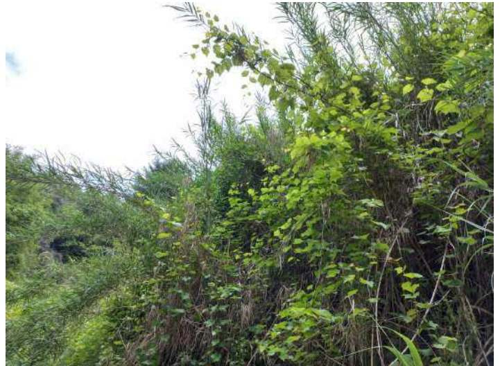
FOTO 5 - Rampicante