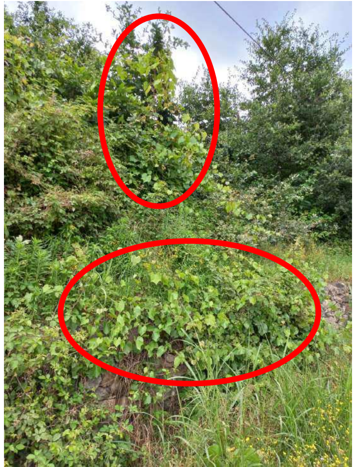
ESEMPI DI VITE INSELVATICHTA RICOPRENTE LA VEGETAZIONE ERBACEA E ARBOREA; LE FOTO NE EVIDENZIANO IL CARATTERISTICO PORTAMENTO