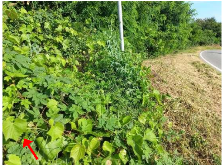
PORTAMENTO DELLA VITE E DETTAGLIO FOGLIA