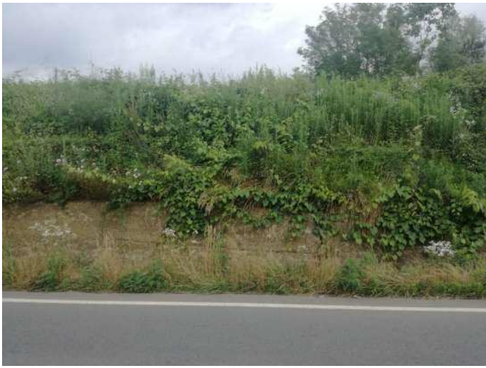
PORTAMENTO VITE INSELVATICHTA SU MURO