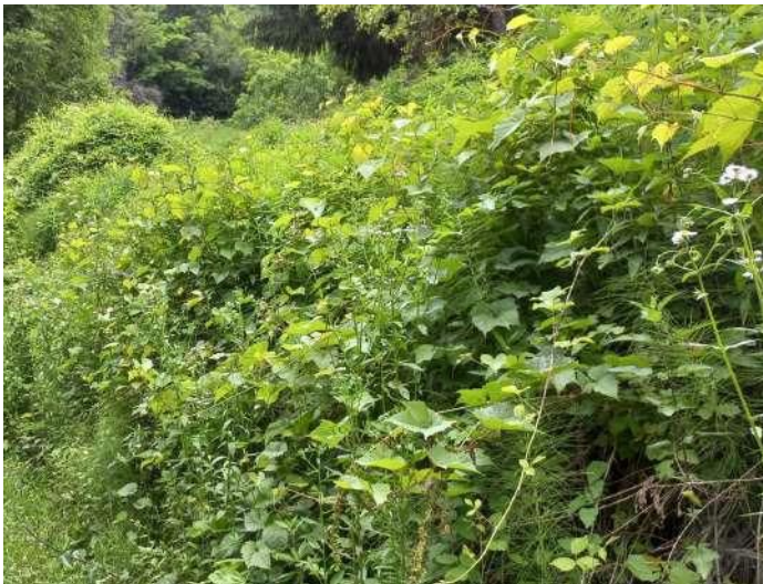
FOTO 4 - Cespugliosa