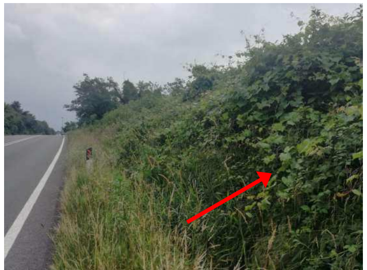
LA FOTO MOSTRA VITE INSELVATICHTA CRESCIUTA SU ROVI